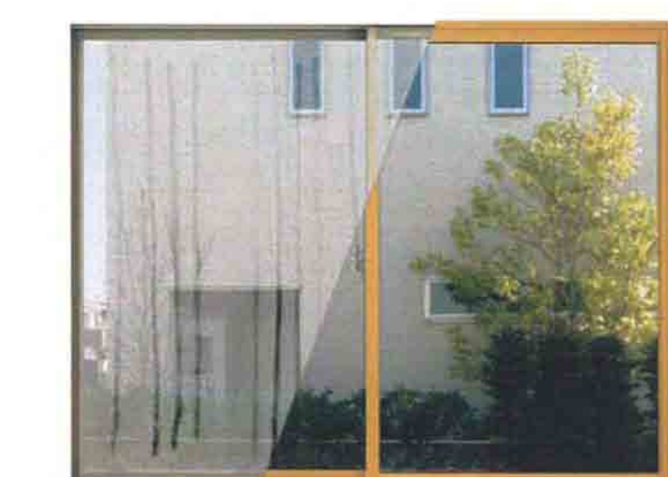
外窓のみ 外窓+インプラス

既存の窓と、内装として取り付け付けたインプラス、さらにその間に生まれる新しい空気層が室外と室内をしっかり隔てる構造に。大きな断熱効果で外気温の影響を受けにくく、結露の発生を抑えます。